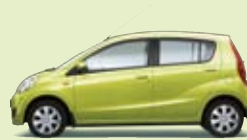
Smaragdgrün Perleffekt (G41)