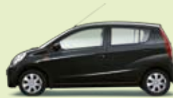
Schwarz Perleffekt (X07)