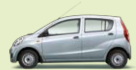
Arktissilber Perleffekt (S28)