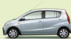
Arktissilber Perleffekt (S28)