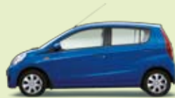
Blau Perleffekt (B58)